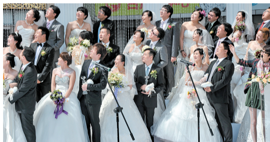
10月5日,上海市中心日月光广场,32对新人在此举行集体婚礼。