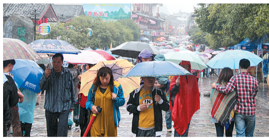
阳朔西街街头,雨伞罩住了人群,倒别有一番风味。