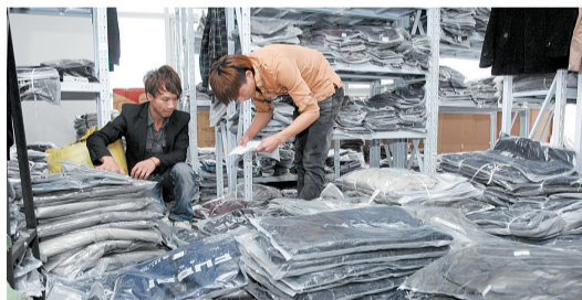
10月4日,一家经营服装的店铺内,两位伙计在根据网上买家的需求打包。