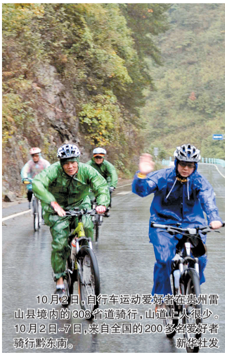
10月2日，自行车运动爱好者在贵州雷山县境内的308省道骑行，山道上人很少。10月2日~7日，来自全国的200多名爱好者骑行黔东南。新华社发

整个山中几乎找不到几位游客。10点半赶到北侧的凤凰山景区，在山中18号农家乐大院，这个号称凤凰山里的“裕达国贸”的小饭店，中午吃饭的只有3桌。老板长叹：“放了长假，郑州的人都到远处游去了。”