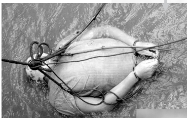
遇难船员死状凄惨