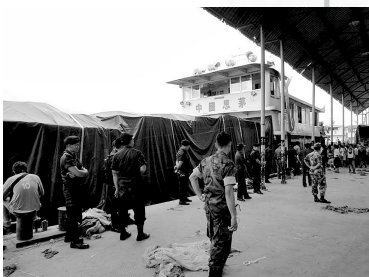
泰国警方进行调查

由于事件的真相尚未查明, 为了确保我国船员的人身安全, 云南省已经暂停了湄公河—澜沧江的航运。