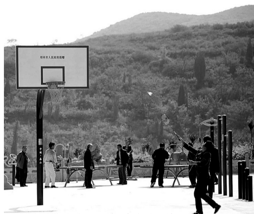
村民在大院里的室外运动场活动。

据悉,在我市,包括金井沟村在内,共建立了12个这样的农村文化大院,深受广大农民的欢迎。