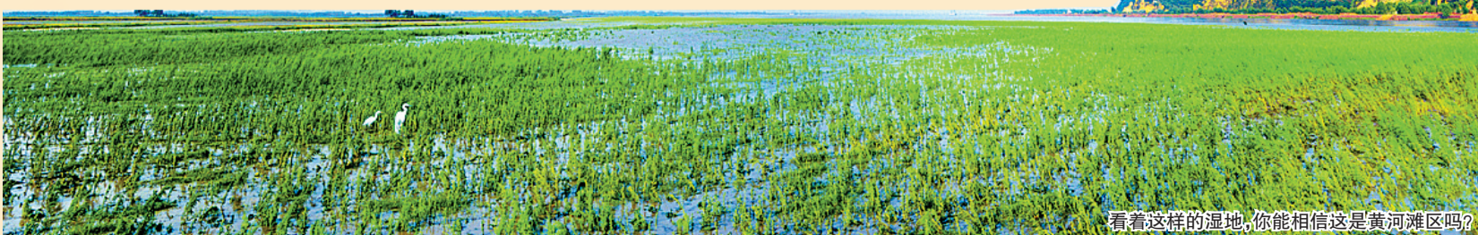
看着这样的湿地,你能相信这是黄河滩区吗?

漫步星海湖周围2500米长的环湖道路,两岸垂柳舞起清风,各种植被错落有致,各色花木衔接成荫。柳下有自然淳朴的仿木小椅子供您小憩,荡绳软梯、绳笼钻网、秋千踏道、原木攀岩等项目供您游玩。老人可体会浅滩踏浪、岸边垂钓的休闲惬意,成人可领略跑马场上纵马驰骋的惊险刺激,孩子可在孔雀园与动物嬉戏。