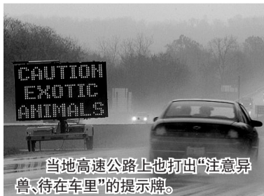
当地高速公路上也打出“注意异兽、待在车里”的提示牌。