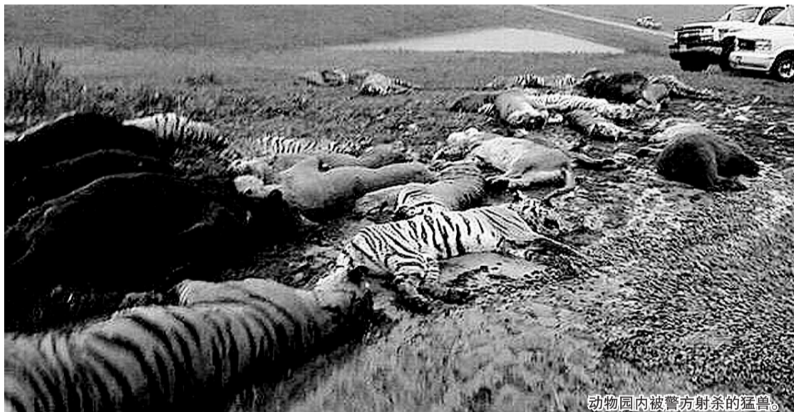
动物园内被警方射杀的猛兽。

美国俄亥俄州从18日晚开始上演惊险一幕:一名野生动物园主在自杀之前将其豢养的大约56只动物全部释放,警方连夜四处寻找追杀逃窜的猛兽,最后射杀了48只动物。