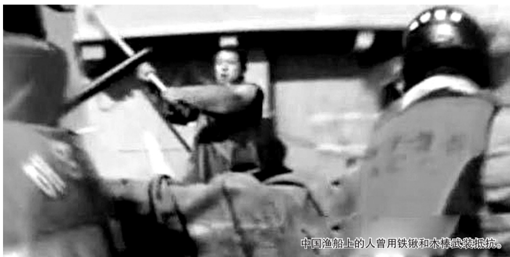
中国渔船上的人曾用铁锹和木棒武装抵抗。

据美国媒体23日消息，韩国全南木浦海洋警察署表示，全罗南道木浦海洋警察22日用武力扣押了3艘中国渔船，称渔船涉嫌“非法捕捞作业”。中国驻韩国光州领事馆已经紧急处理此事。领馆方面称，扣押事件中有中国渔民受伤，但是没有人死亡。领馆已经要求韩国方面在执法过程中避免暴力，韩方要对伤员尽全力救治。