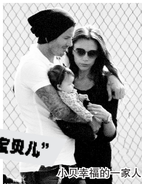
小贝幸福的一家人

“有什么滋味比亲吻小孩更好呢？”卡卡和卡罗琳的女儿从小就有着明星的范儿。照片里，她瞪大眼睛，微张小嘴，可爱至极。