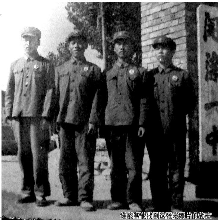
谁能帮他找到这张老照片的战友