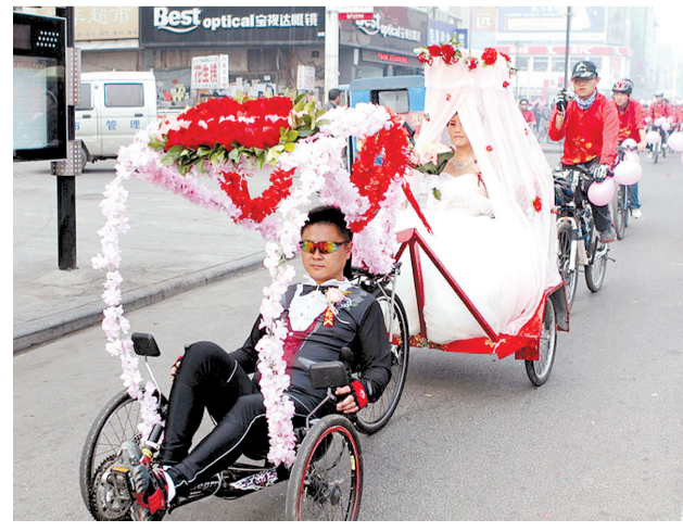
“喜之郎” 10月22日,开封。新郎、新娘都是骑手,大喜之日,新郎用别致的单车迎娶新娘,骑友们骑着单车浩浩荡荡迎送。 刘罗锅