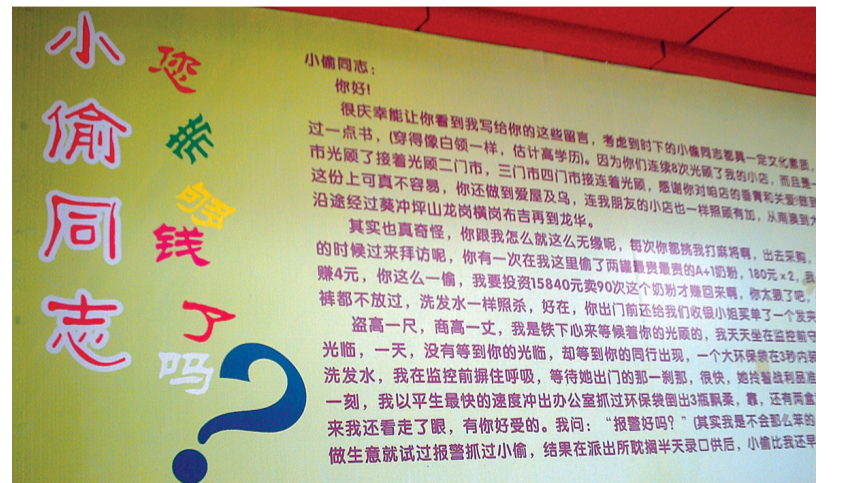
给小偷的留言 湖南一商店因经常被小偷光顾,店主便给小偷写了一封信张贴在店门旁,以示警告。 阳蒲生