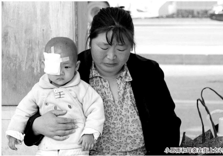
小思雨和妈妈在街上乞讨