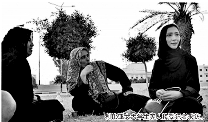
利比亚女大学生等人接受记者采访。