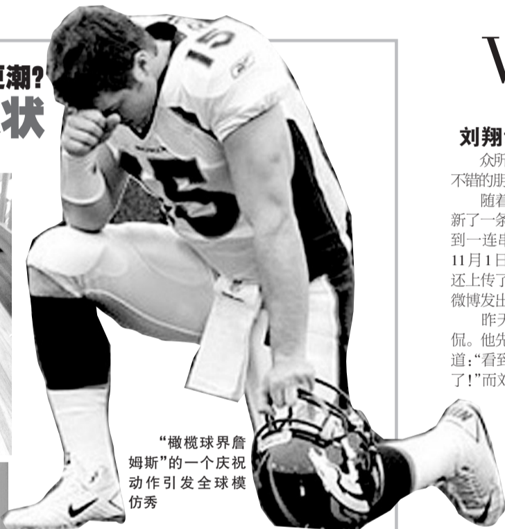
“橄榄球界詹姆斯”的一个庆祝动作引发全球模仿秀