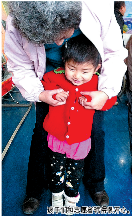
孩子们和志愿者玩得很开心。