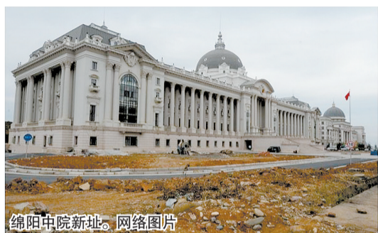
绵阳中院新址。网络图片