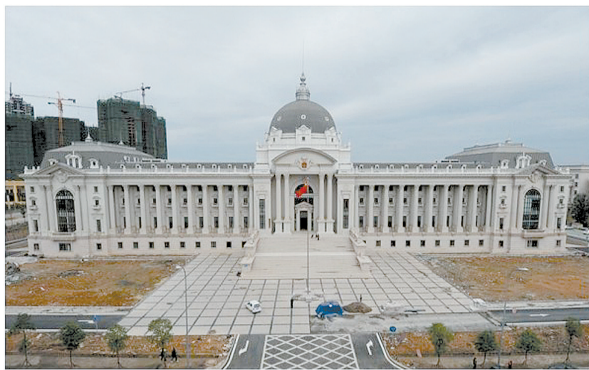
绵阳中院新址。网络图片