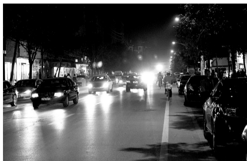
时间:晚上7:23 地点:兴华北街 晚报记者 马健 图