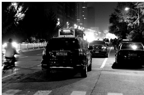
时间:晚上7:33 地点:陇海路外语中学门前 晚报记者 马健 图