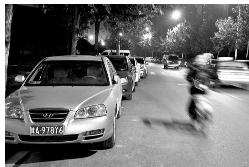
时间:晚上7:30 地点:金水区渠东路快车道上