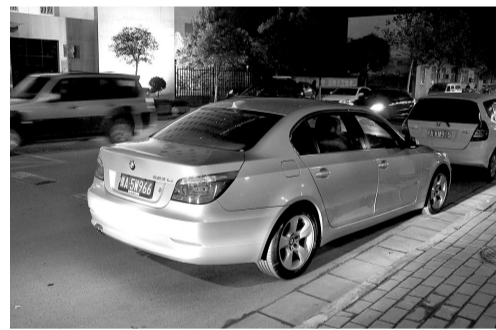
时间:晚上8:10 地点:广电路