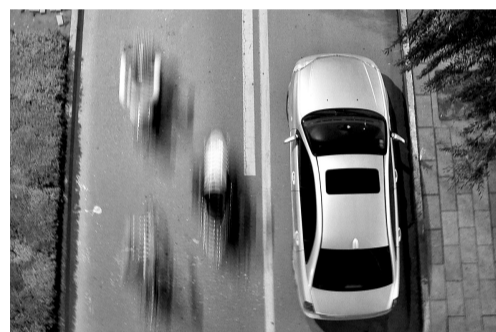
时间:晚上7:50 地点:融元广场门前的花园路辅道