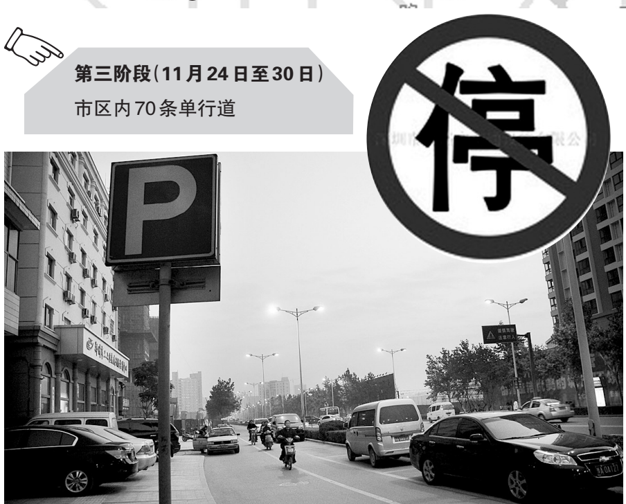
昨日下午,嵩山路南段路边停了不少车辆。