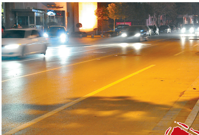
时间:晚8:00 地点:广电路 违章乱停的车辆消失了。晚报记者 周雨 图