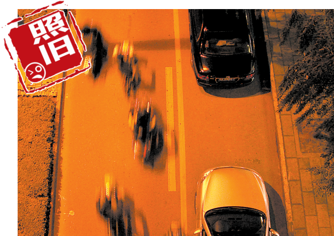
时间:晚8:00 地点:融元广场门前的花园路辅道 此处依然停放着两辆车。