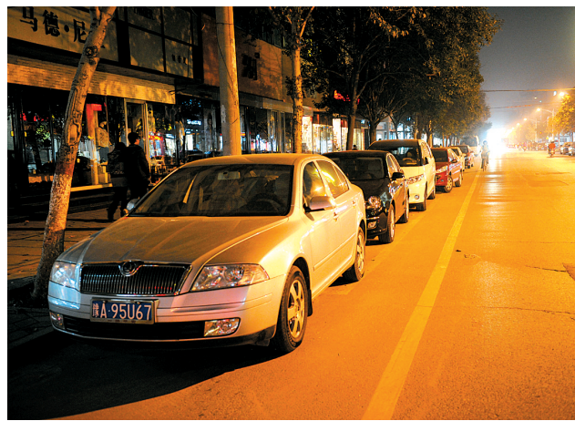
时间:晚8:31 地点:兴华北街 占道停车问题依旧。晚报记者 张翼飞 图