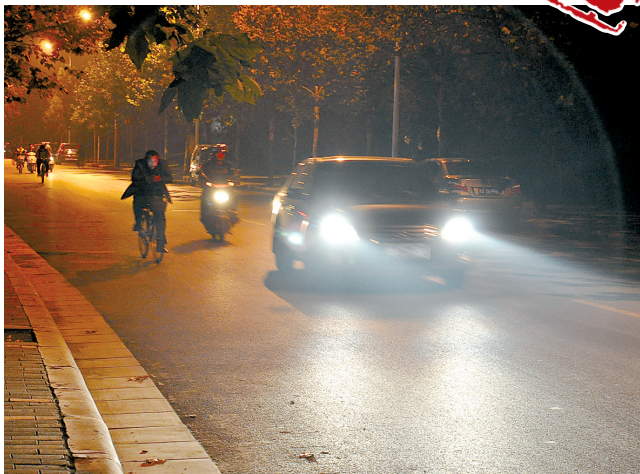
时间:晚7:40 地点:金水区渠东路 此处没有了乱停放的车辆。晚报记者 周雨 图