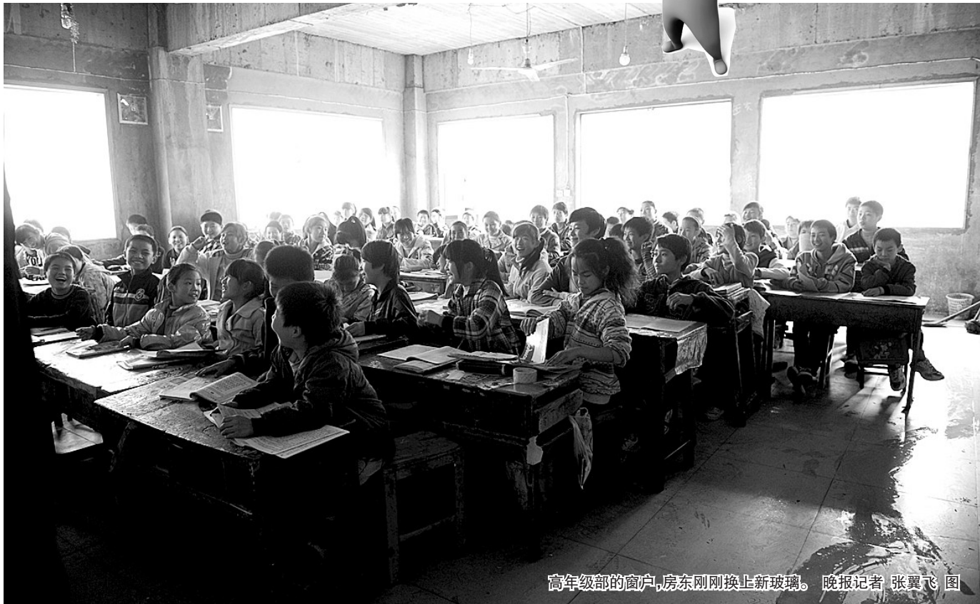
高年级部的窗户,房东刚刚换上新玻璃。