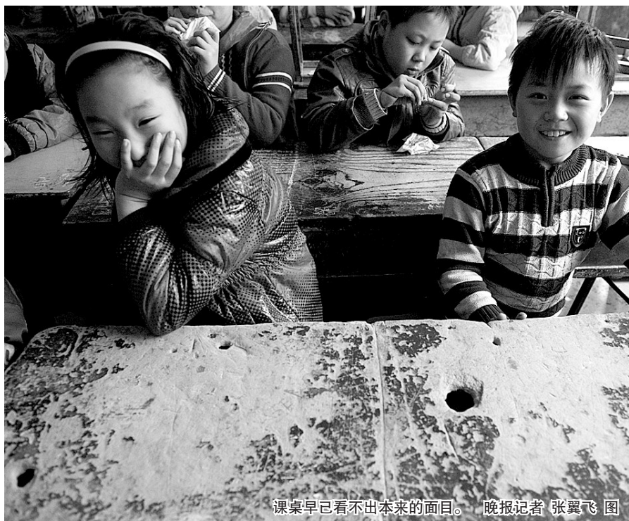
课桌早已看不出本来的面目。