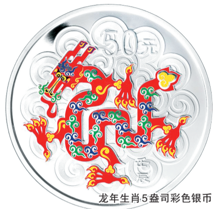
龙年生肖5盎司彩色银币

承担河南地区生肖币发售工作的河南省钱币有限公司工作人员介绍,生肖一直是中华民族源远流长的主流文化,也是贵金属纪念币中的热门题材,加之龙作为中华民族的图腾,因此龙年金银币更格外受到收藏投资者们的关注。目前梅花形龙年生肖金银币现货已经销售一空。其他如彩色、扇形、本色金银币等品种现货也所剩不多。