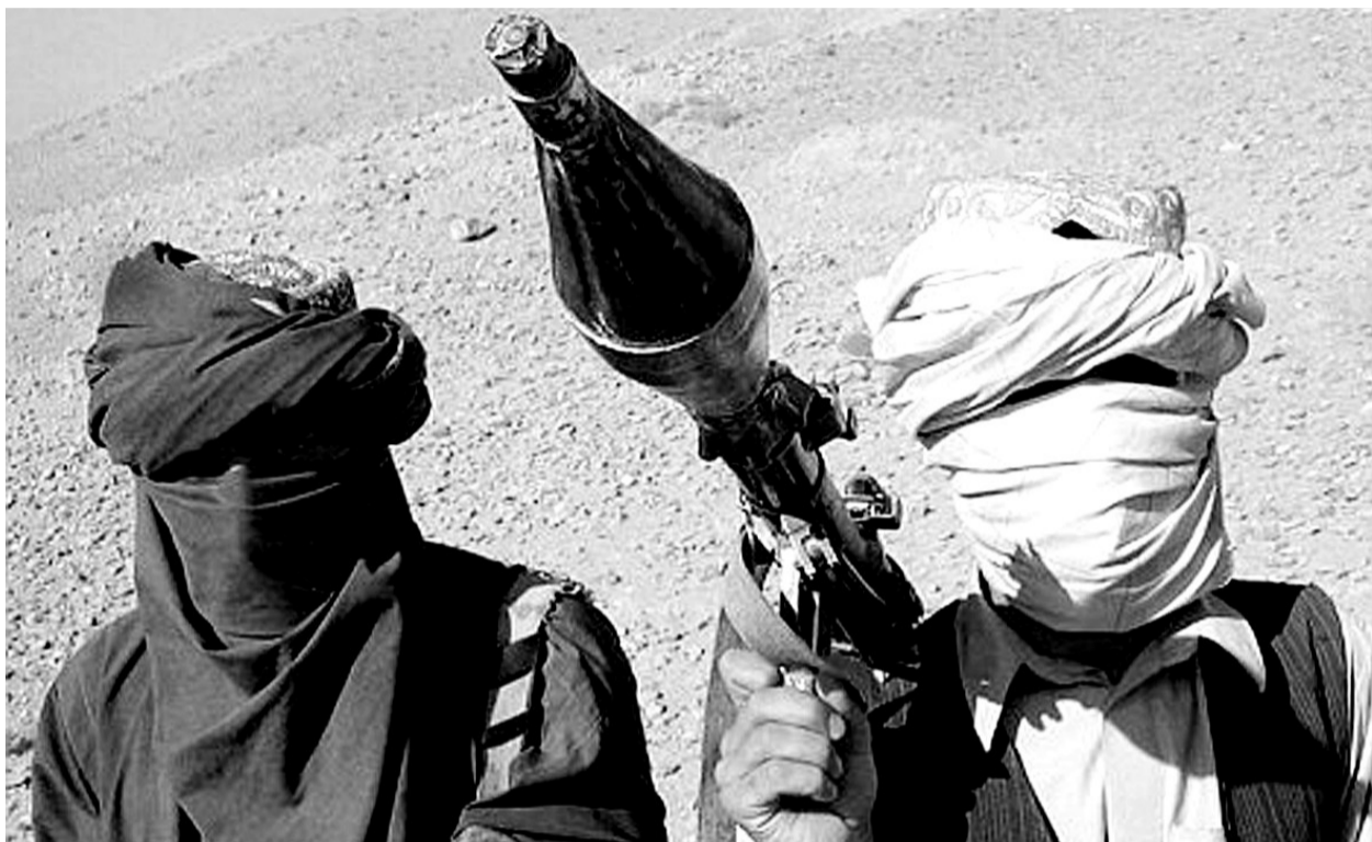
手持武器的塔利班分子