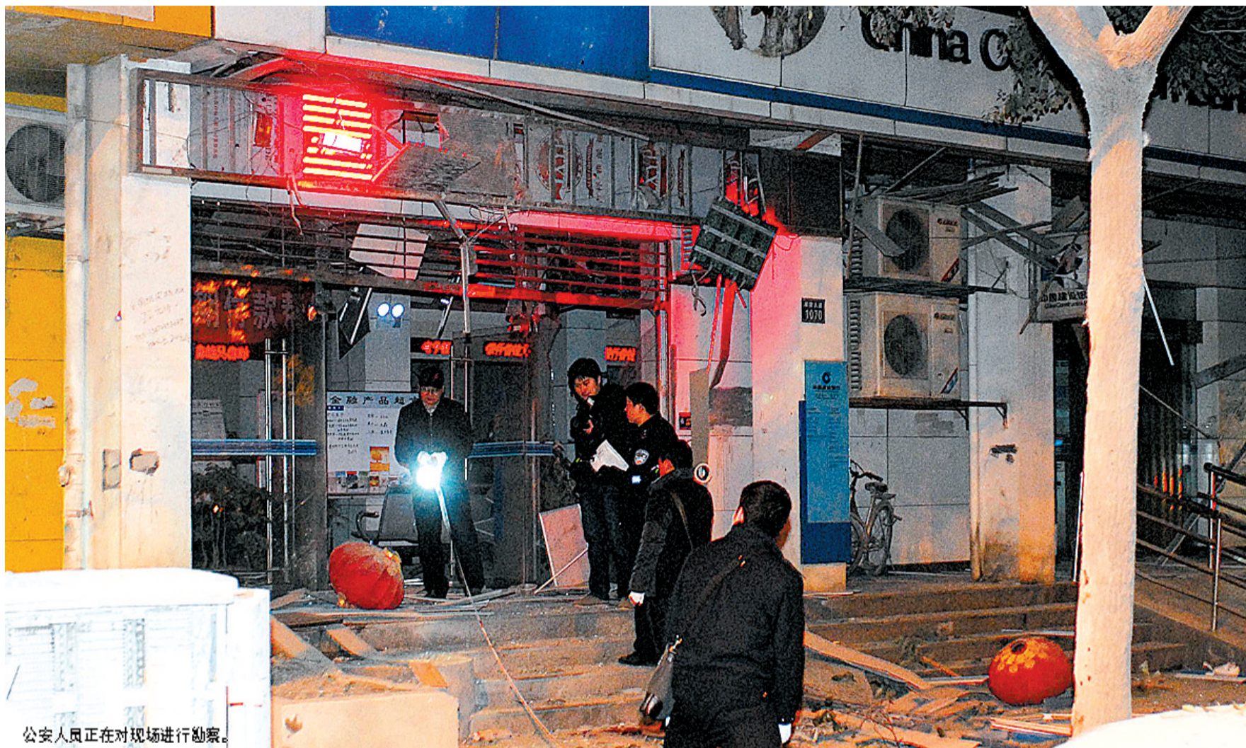
公安人员正在对现场进行勘察。