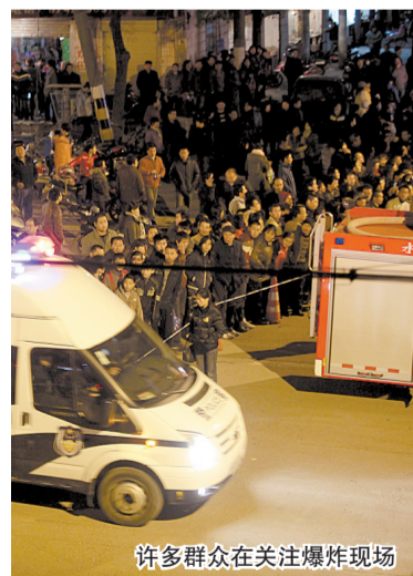
许多群众在关注爆炸现场

记者了解到，目前在湖北中医院住院的4名伤者中，一名广西柳州人，男，45岁；两名武汉人，均为女，一人50多岁，一人30岁左右；一名关山中学高二女生，17岁。