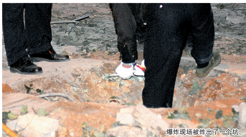
爆炸现场被炸出了一个坑。