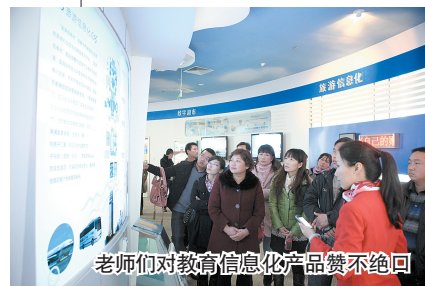
老师们对教育信息化产品赞不绝口

“用发短信的方式与学生家长保持联系，不仅方便了学校开展工作，更有利于家长教育孩子。”日前，由郑州移动承办的“我的梦想，未来世界”教师交流活动隆重举行。来自新郑、新密、中牟等县市的10余位农村小学校长、教师和来自郑州市政通路小学的教师代表齐聚一堂，共同分享了在教育、教学方面的心得、体会。