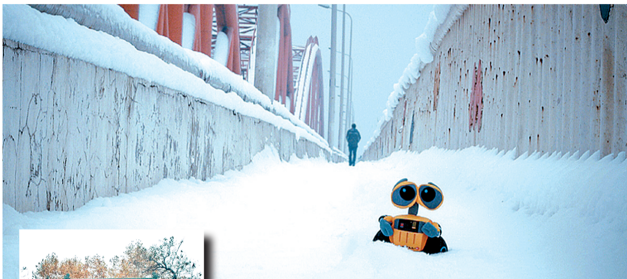
瓦力城市漫游记:2011年3月1日 瓦力在雪后的北环彩虹桥上。