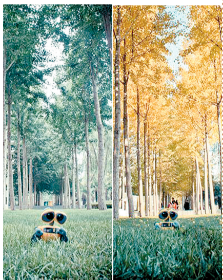
瓦力城市漫游记:2011年11月13日 时间的颜色。7月15日它说:“盼望着这些银杏树叶变黄的日子。”4个月之后,盼到了。