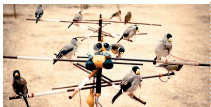
瓦力城市漫游记:2011年1月20日 瓦力在花园里遇到一群在表演的鸟儿。

郑州有一个网友叫哪吒,他的微博里每一天的照片都离不开一个主角——可爱的机器人玩偶“瓦力”。