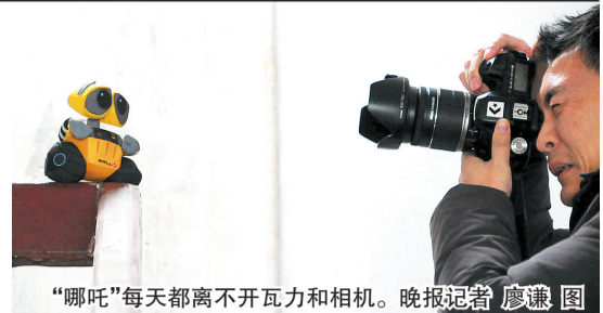
“哪吒”每天都离不开瓦力和相机。

“瓦力”是一个可爱的大眼睛机器人玩偶主人“哪吒”喜欢带着它逛郑州海外生活的“小女生”网上留言