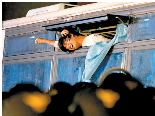
2011年9月29日,韩国首尔,中心街道静坐示威的一名大学生在被警方拘留后,在警车中高喊口号。周四的大学生示威游行,要求总统李明博履行竞选时将学费减半的承诺,并要求为青年失业人员提供解决方案。