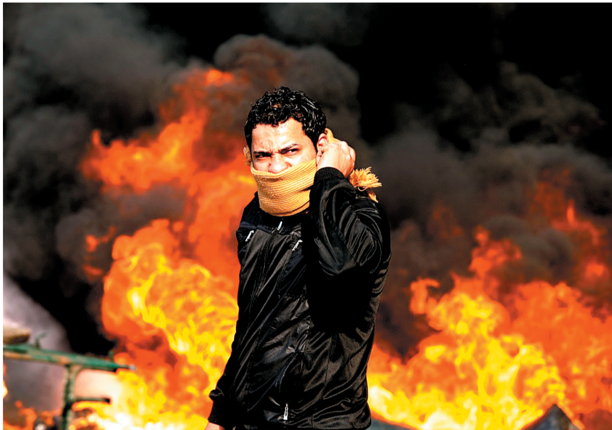
2011年1月28日,埃及开罗,一名示威者站在燃烧的路障前。埃及当日发生大规模游行示威活动,抗议者在开罗市中心聚集,高喊口号,煽动路人加入抗议队伍,警察发射催泪瓦斯驱散人群。