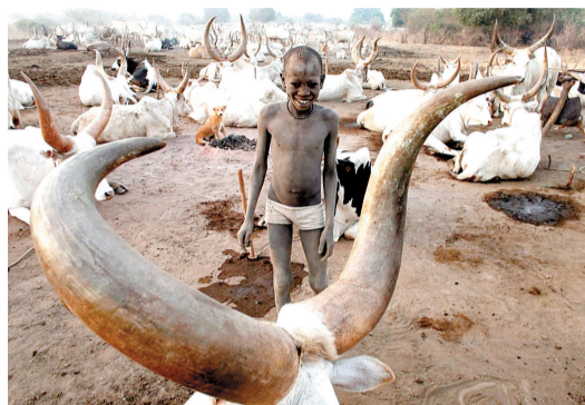
2011年1月19日,南苏丹中赤道省Terekeka附近,在其定居点中,一个来自蒙达语游牧部落的男孩在晨光中微笑。