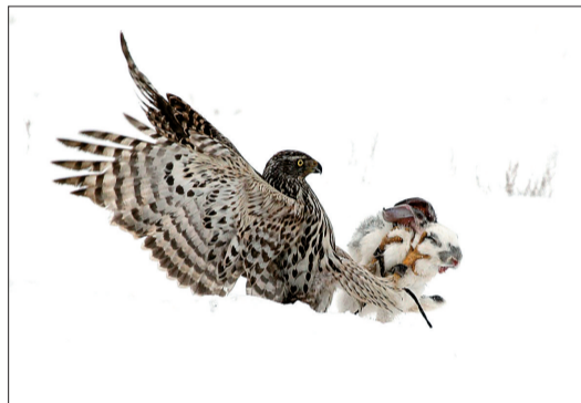
2011年2月12日,阿拉木图外Uzynagash村附近,在一场年度狩猎比赛中,一只老鹰袭击了一只野兔。哈萨克斯坦萨亚特民族运动(猎鸟大赛)在亚洲中部国家十分流行。

2011年3月11日,名取郡,房屋被地震和海啸之后的海水淹没。8.9级大地震在周五袭击了日本东北部,导致多人受伤,起火并引起该国海岸沿线部分地区10米高的海啸。