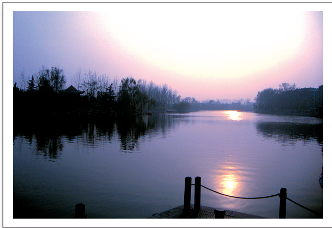
▲西边的太阳就要落山了