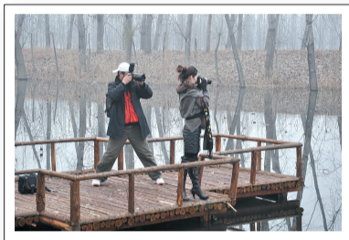
▲你拍别人 我拍你