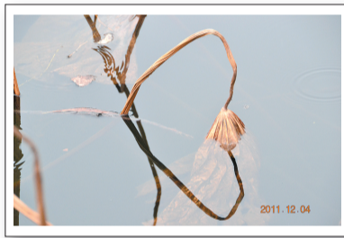
▲深秋荷韵