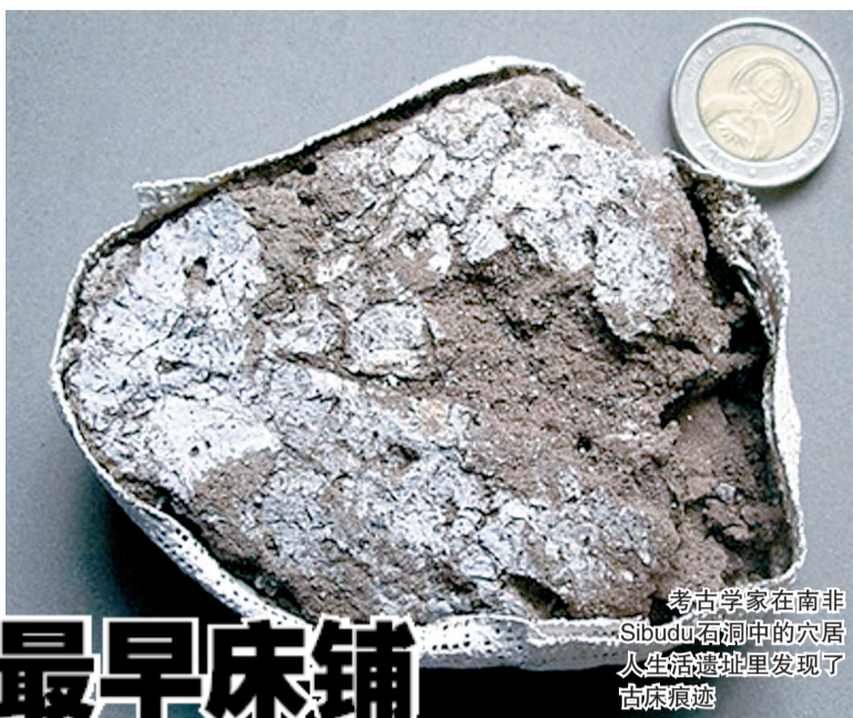
考古学家在南非Sibudu岩洞中的穴居人生活遗址里发现了古床痕迹