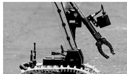
印度计划10年后将机器战士投入实战。

他还说，机器人士兵能装备大量弹药，负载沉重的设备，比方说携带探雷和侦察设备，而且要实现远程操控。印度边境高原地区不适合人类生存，而机器人士兵可完成人类士兵难以完成的边境防备任务。