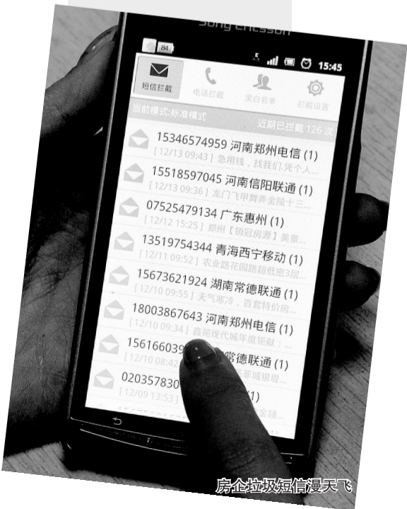
房企垃圾短信漫天飞

垃圾短信涉嫌侵犯市民的权利有: 1.涉嫌侵犯他人安宁权 垃圾短信的特点就是骚扰他人,影响他人生活的安宁。尽管这种行为并没有造成财产上的,或者人身上的损害,但是它造成了受害人的精神损害,也就是人格利益的损害或者人格权的损害,因此,符合侵权行为的构