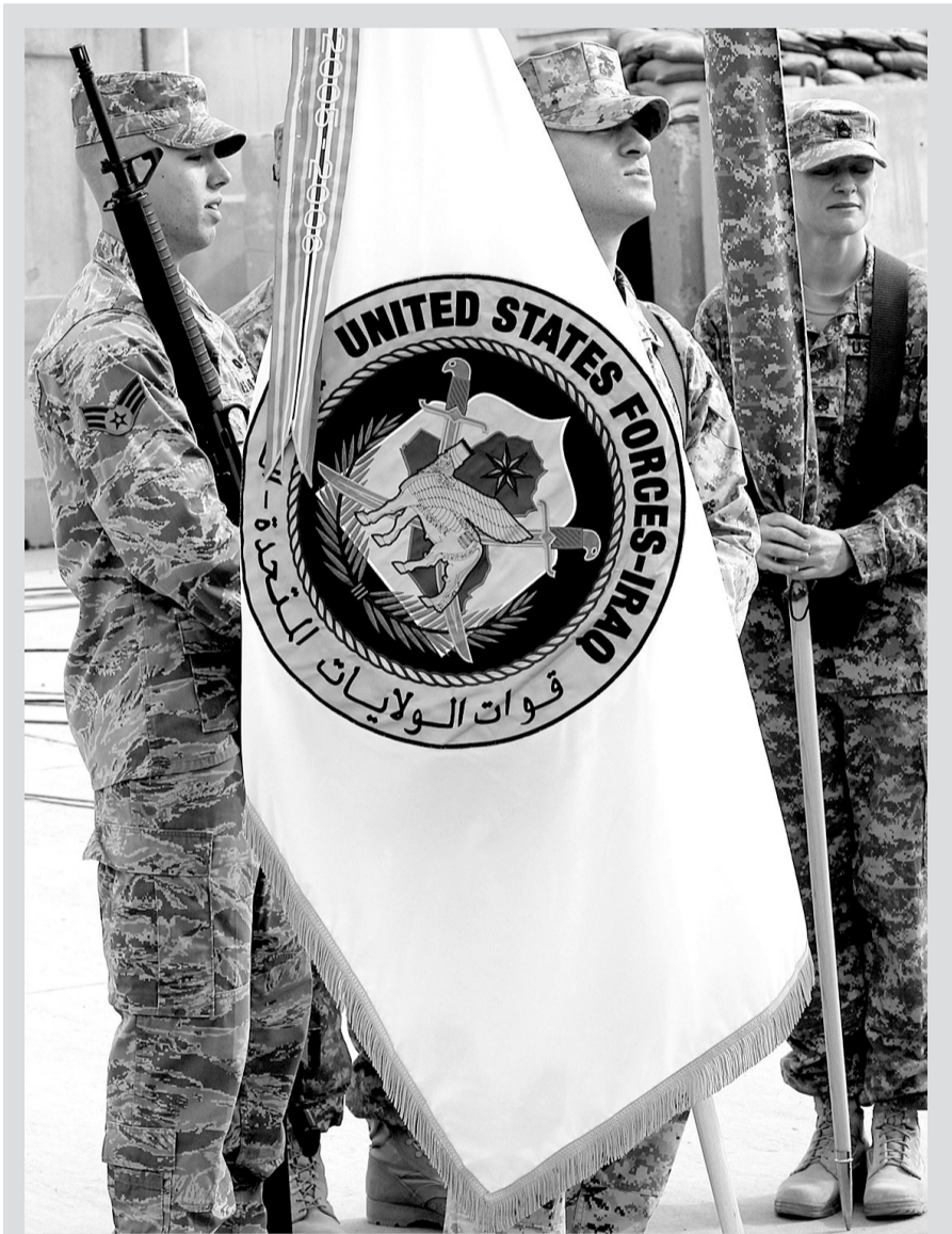
12月15日,在伊拉克首都巴格达附近地区,驻伊美军士兵在美国的空军基地手持旗帜等待结束任务仪式开始。

伊拉克战争中,人口50万的费卢杰曾是一处主战场。美国2003年3月发动伊拉克战争后两个月,反美情绪首先在费卢杰爆发,一些当地民众朝美军士兵扔鞋子,拉开反美活动的序幕。