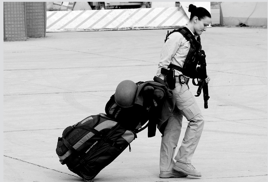
12月15日,在伊拉克首都巴格达附近地区,一名驻伊美军士兵在美国的空军基地搬运行李准备离开。