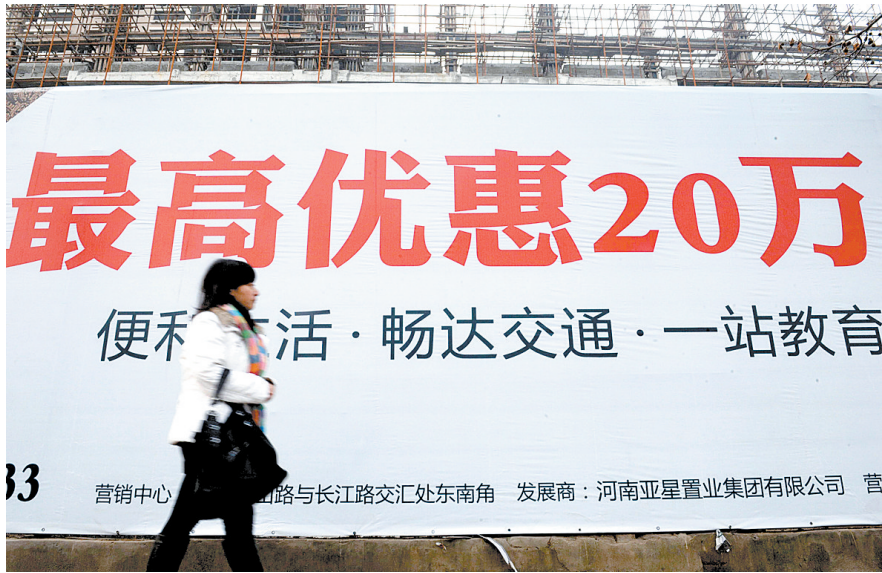
长江路,某房产楼盘打出最高优惠20万元的广告。 晚报记者 马健 图

郑州楼市正在加速过冬。昨日,郑州市住房保障和房地产管理局公布的数据显示,11月份,市区商住房合计卖了3237套,比10月份少卖1278套;房价每平方米6290元,比10月份跌了203元。11月份郑州商住房销量和价格双双创出近7个月来的新低。 晚报记者 胡审兵