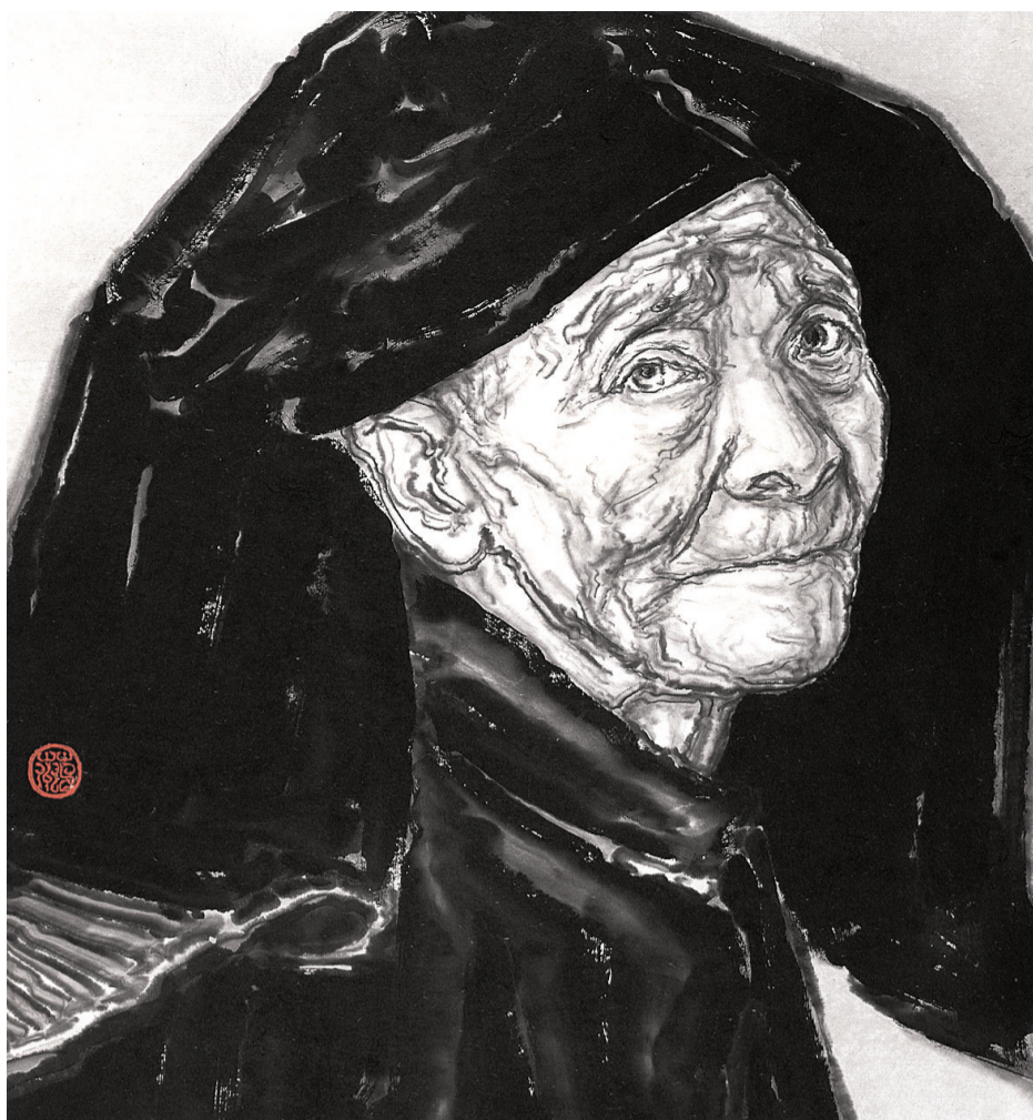
八月之诗 41cm x 45cm