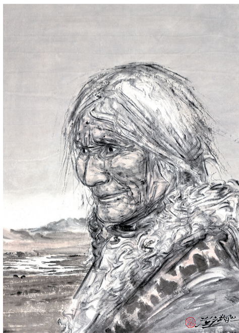
高风行记 45cm x 68cm