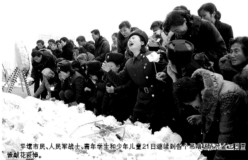
平壤市民、人民军战士、青年学生和少年儿童21日继续到各个吊唁场所对金正日国哀悼花哀悼。