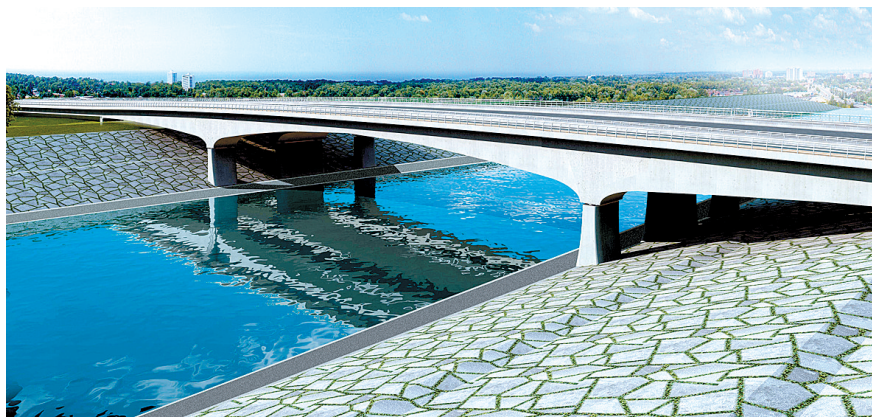
长江路:总投资5840.17万元。红线宽55米,全长260米(其中桥长170米),三幅桥,2幅宽11米,1幅宽24米。