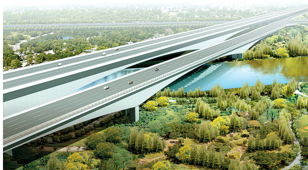
陇海路:总投资26899.68万元。红线宽64米,地面南辅道总长度631.5米;地面北辅道总长度642.2米;三幅桥,长度330米,桥梁总宽64.5米,中幅宽25.5米,南北两幅各宽18.5米。