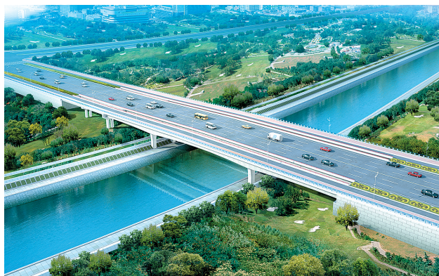
雪松路:总投资5930.61万元。红线宽50米,全长439.509米(其中桥长129.72米),桥面全宽56米,三幅桥,2幅宽9米,1幅宽29米。