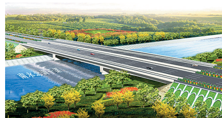
西四环桥:位于郑州市中原西路与西四环路交叉口南侧约100米,主要技术标准采用一级公路标准,设计车速每小时80公里;设计荷载为公路-I级;快车道为双向六车道,慢车道为双向四车道;路面面层采用沥青混凝土结构。