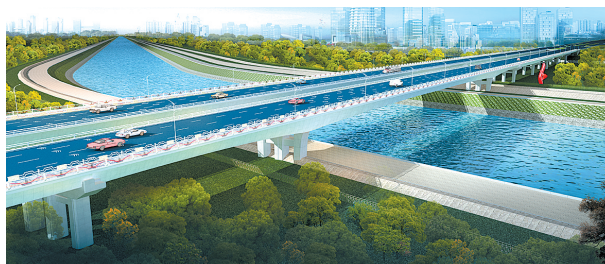
元通大道:总投资9942.88万元。红线宽45米,全长561.4米(其中桥长318.4米),双幅桥,单幅宽20.5米。