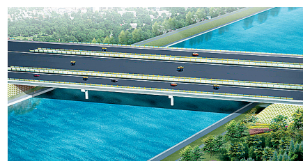
郑上路桥:位于郑州市须水西约2公里处,主要技术标准采用二级公路标准,设计车速每小时80公里;设计荷载为公路-I级;快车道为双向六车道,慢车道为双向四车道;路面面层采用沥青混凝土结构。