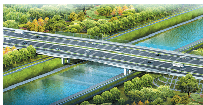
红松路:总投资7698.61万元。红线宽60米,全长460米(其中桥长150米),桥面全宽60.5米,双幅桥,单幅桥宽27.75米。