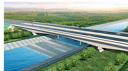
南四环桥:位于G107辅道十八里河附近,主要技术标准采用一级公路标准,设计车速每小时80公里;桥梁设计荷载为公路-I级;快车道为双向六车道,慢车道为双向四车道;路面面层采用沥青混凝土结构。