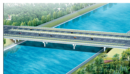
郑密公路桥:位于S316线黄岗寺南,主要技术标准采用一级公路标准,设计车速每小时80公里;桥梁设计荷载为公路-I级;快车道为双向六车道,慢车道为双向两车道;路面面层采用沥青混凝土结构。