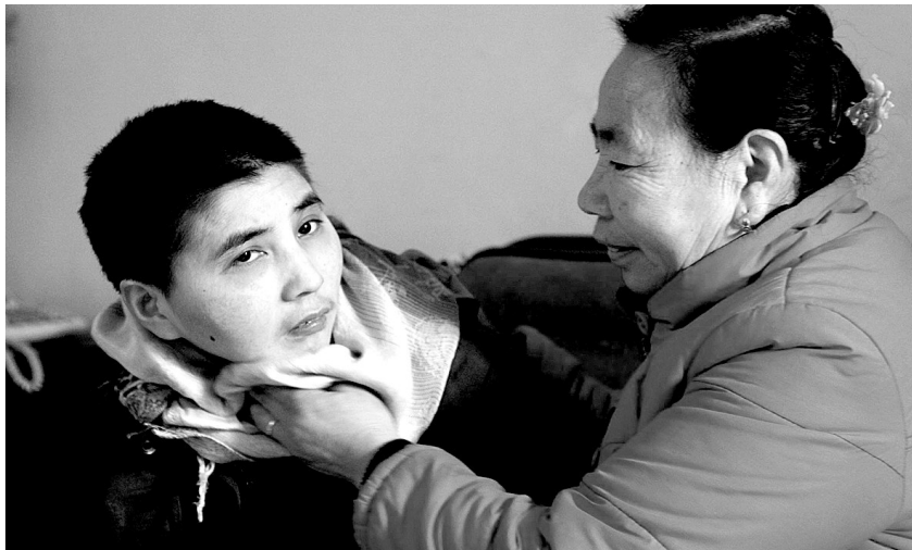
母亲在悉心照顾病中的女儿

继元旦前米、面、油、棉被等救助后,昨日下午,记者跟随郑州慈善周周行工作人员再次来到李芳家中,给她们送去500元春节慰问金。 晚报记者 裴蕾 文/图