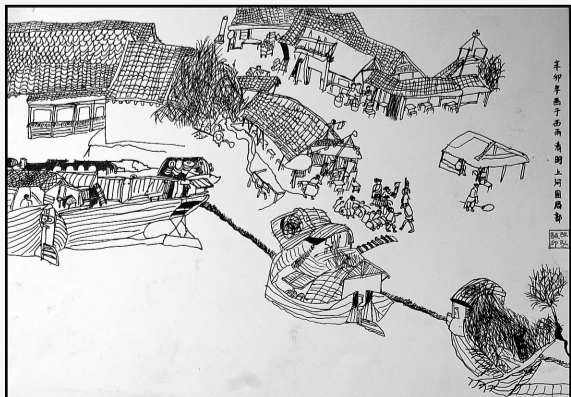
《清明上河图》 张弘毅 男 8岁 辅导老师 左倩倩