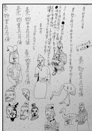
《兵马俑的印象》 李丹乔 女 8岁 辅导老师 林超