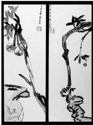
《花鸟小品》 郭鑫梓 女 9岁 辅导老师 左倩倩