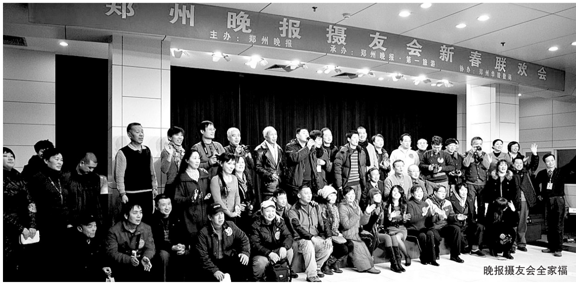
晚报摄友会全家福