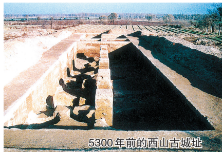
5300年前的西山古城址