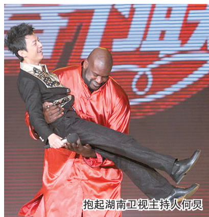
抱起湖南卫视主持人何炅

皮影戏舞毕竟不是奥尼尔的演出，经过短暂模仿跟大家交流之后，奥尼尔开始跟自己的搭档——20个河南某武术学校的小朋友套近