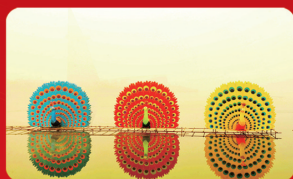
《水上孔雀》：在湖面漂浮着绚丽多彩的孔雀，勾画出一幅美丽的画卷。