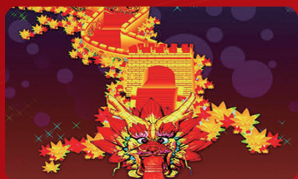
《长城龙影》：该灯组将长城与龙这两种元素巧妙地结合在一起，寓意在新的一年里生活吉祥富贵，工作事业有成。

灯会由49组绚丽灯组组成，分为“主题灯区”“传统民俗非遗灯区”“神话传说灯区”“活动参与灯区”“环境陪衬灯区”“炫丽水上灯区”等6大主题灯区。