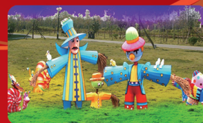
《稻草人乐园》：稻草人乐园以可爱的卡通形象，给小朋友营造出有趣、可爱的游玩环境。