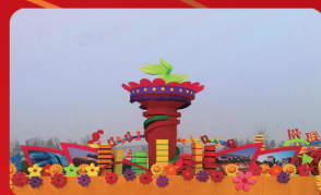
《魅力郑州》：展现出河南美好的民俗民风、辉煌的历史文化、生机勃勃的发展历程与光辉灿烂的未来。