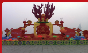
《红火龙年》：红红火火过大年。