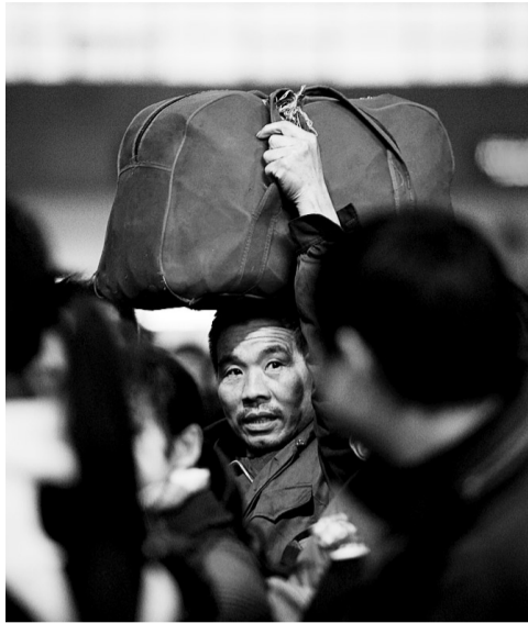
昨日下午4时,在郑州火车站候车大厅,即将检票的进站通道人头攒动。

2012年的第一场小雪到底来没来呢?其实,它已经悄悄来过郑州,昨天早上8、9点出门的人和它有个短暂的邂逅。很多人都与它擦肩而过了。