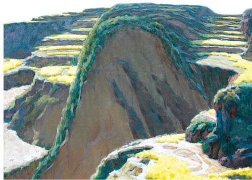
《遍山菜花》 油画 50cm x 61cm 2004年