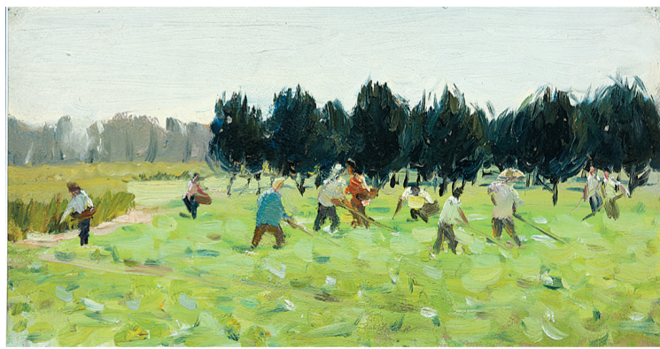
《关虎屯菜地》 纸本油彩 20cm x 39cm 1969年