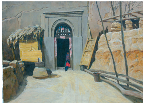
《家》 油画 79cm x 60cm 1991年