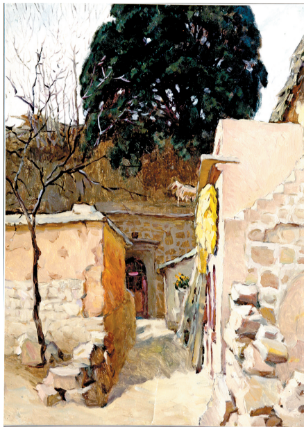
《夹津口村巷》 纸本油彩 39cm x 54cm 1981年