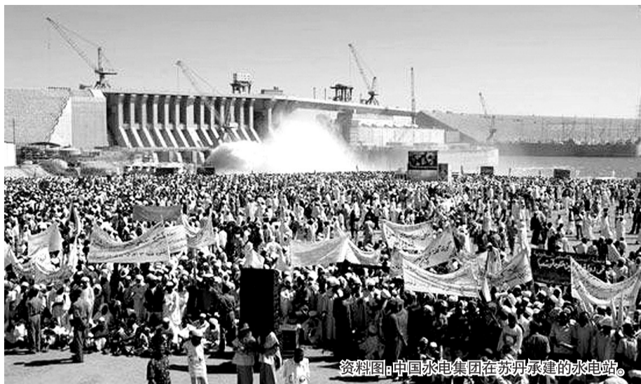
资料图:中国水电集团在苏丹承建的水电站。

中国驻苏丹大使馆29日证实,中国中水电公司在苏丹南科尔多州一个工地28日遭到当地武装分子袭击,20多名中国工人下落不明。苏丹南科尔多州州长艾哈迈德·哈伦称,武装人员意在破坏当地的公路建设。