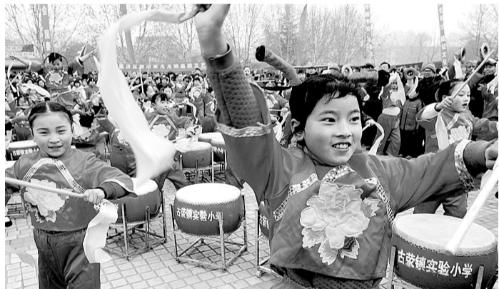
小学生的盘鼓表演

昨天上午10点,“郑州市2012年华夏优秀传统民间文化集中展演活动”在绿城广场隆重启动,百余支文艺表演团体举行了盘鼓表演和小品、评书、民间乐器等曲艺表演,万余名市民群众观看了演出。今明两天,各县(市)区还将在各大文化广场和公园开展民间文艺表演活动。