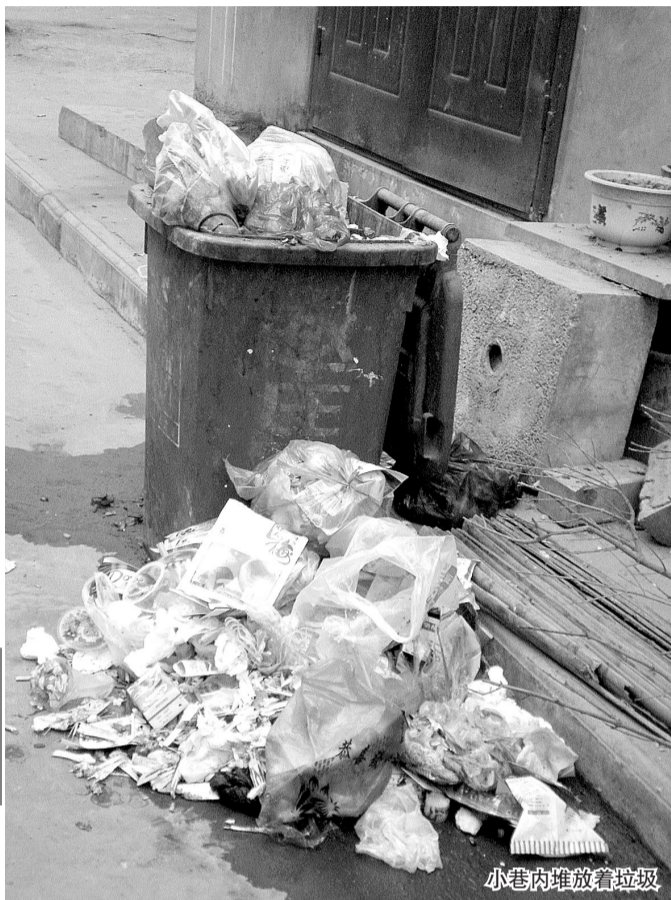
小巷内堆放着垃圾