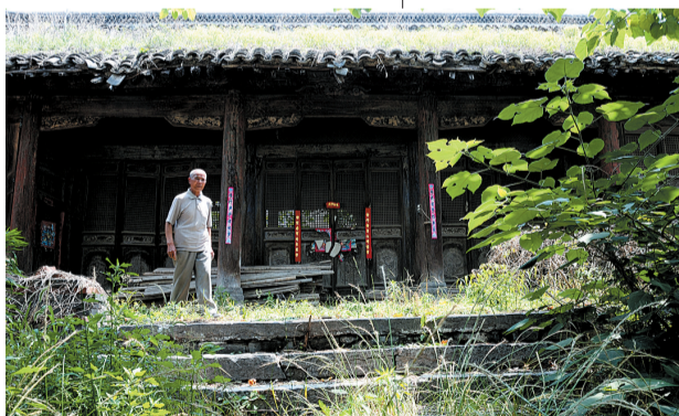
代表了中原四合院文明的古建筑群——苏辙后人故居、荥阳苏氏古建筑群

Bank 中国光大银行 郑州分行 CHINA EVERBRIGHT BANK ZHENGZHOU BRANCH