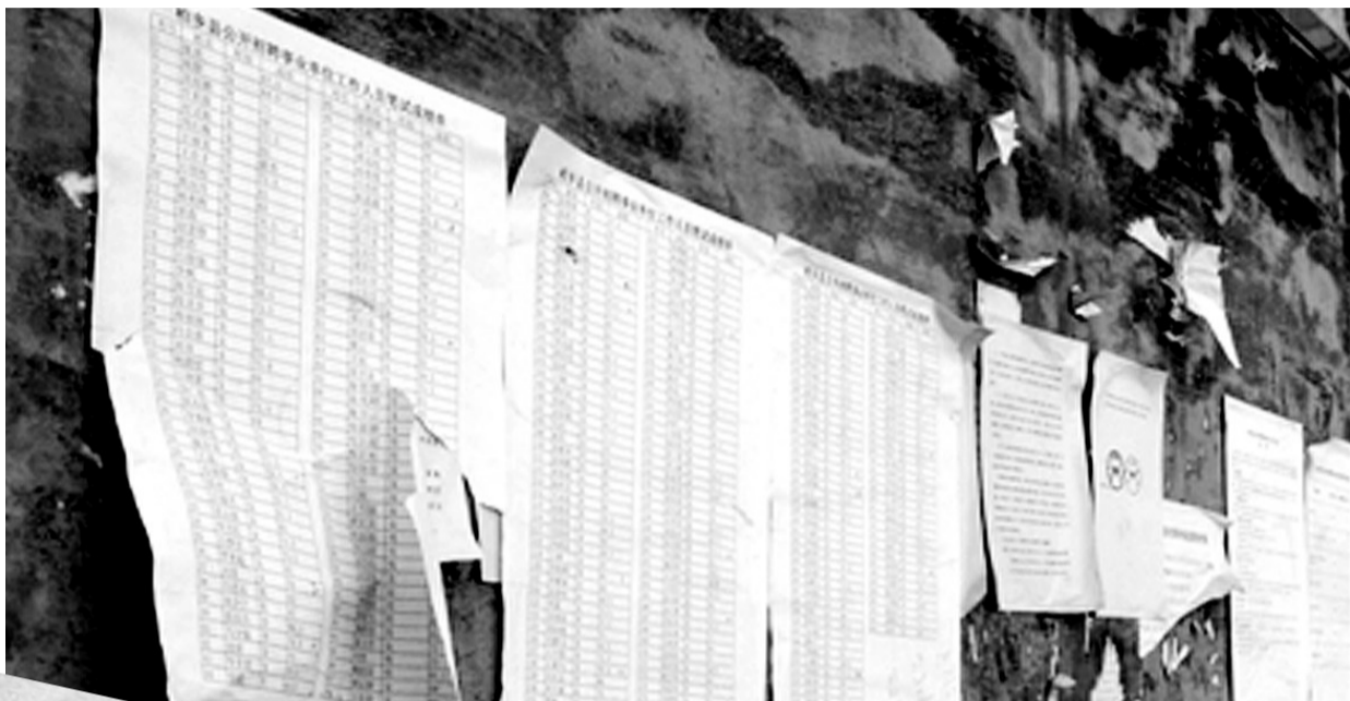
▲2月3日,柏乡县人力资源和社会保障局墙上,仍张贴着招聘考试的笔试成绩。