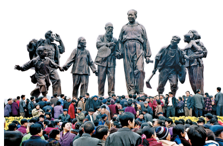
旷惠民拍摄的照片“人们在湘潭参加毛泽东诞辰纪念活动”组照获得艺术娱乐类组照三等奖。