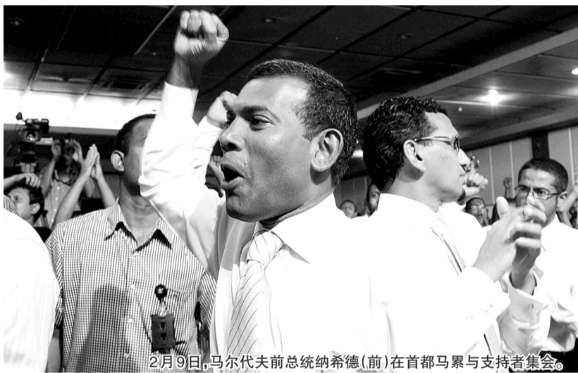
2月9日,马尔代夫前总统纳希德(前)在首都马累与支持者集会。