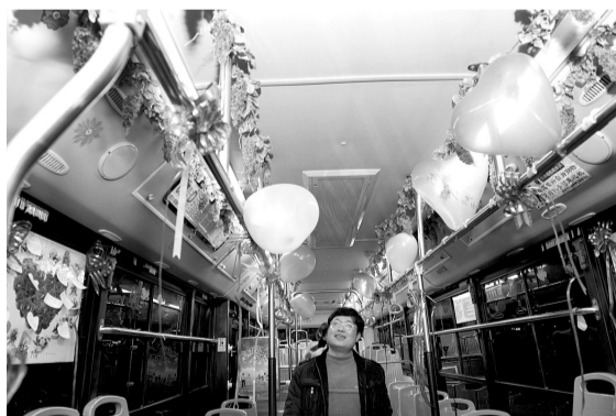
“情人节专车”内饰超温馨