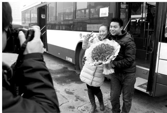
两人在公交前留念